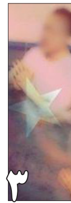
۳ مسیحیان حسینی با کیس پنهانندگی!

www.mohabatnews.com اسکایپ mohabatnews.mohabatnews ایمیل info@mohabatnews.com تلفن ۰۰۱۴۱۶۸۵۴۹۶۹۶ تلگرام mohabatnews@