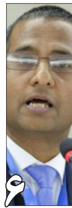
۶ گزارش احمد شهید و کمیسیون آمریکا درباره وضعیت مسیحیان ایران ارتداد مهر بر پیشانی دگراندیشان