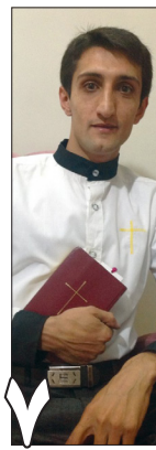
۷ Iranian Christian prisoner encourages fellow believers