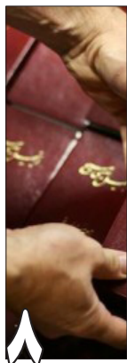
۸ استقبال گسترده مردم از کتاب های با مضمون مسیحی واکنش منفی رسانه های حکومتی

در حالی که دگراندیشان دینی و اقلیت های مذهبی در ایران حتی از حقوق اندک مورد اشاره در قانون اساسی جمهوری اسلامی برخوردار نیستند صد البته داشتن یک رسانه مکتوب یا وبسایت و پایگاه خبری در فضای مجازی برای آنان غیرممکن خواهد بود. سرکوب رسانه های در ایران و عدم فعالیت رسانه های آزاد سبب شده تا اخبار جامعه مسیحیان ایران که شمار آنها با سرعت رو به افزایش است به گوش دیگر شهروندان جامعه نرسد. از این رو اهمیت داشتن یک رسانه مکتوب به ما این اجازه را می دهد تا صدای خود را به